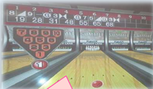
ボウリングスコア画像