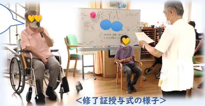
<修了証授与式の様子>

通所リハビリテーションは制度上、ずっとご利用していただけるサービスではありませんが、一度修了されても再度ご利用していただくことは可能です。していたことがしにくくなられたり、新たな目標が出来た際にはどうぞ何度でもご利用ください。再利用、再々利用して下さっている方もおられます。